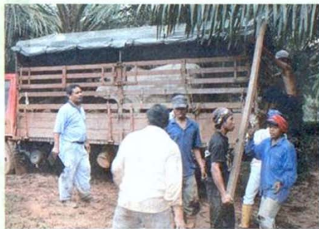
Penjualan lembu di Ladang Sungai Sembong, Kahang, Kluang.

Menurutnya, menjadi sasaran syarikat memiliki 4,000 ekor induk betina dengan pengeluaran anak jantan sekitar 1,000 ekor setahun.